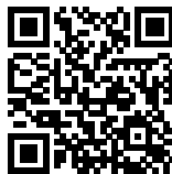
Abbildung 3: YouTube – Koonys Schule – Figuren drehen - Drehung von Figuren [hauchdünn]